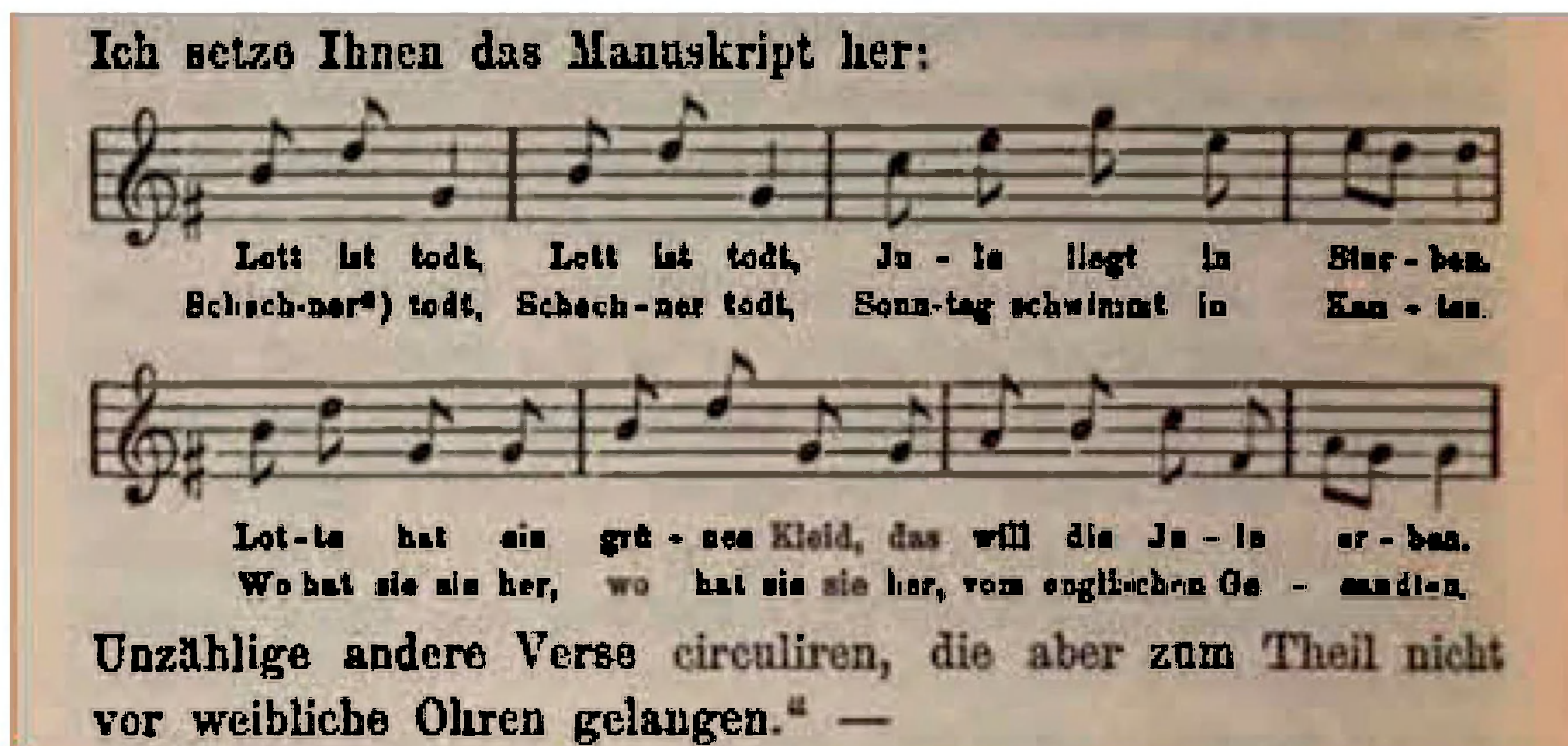
Visen med melodi i Fanny's brev - "Lott ist todt".