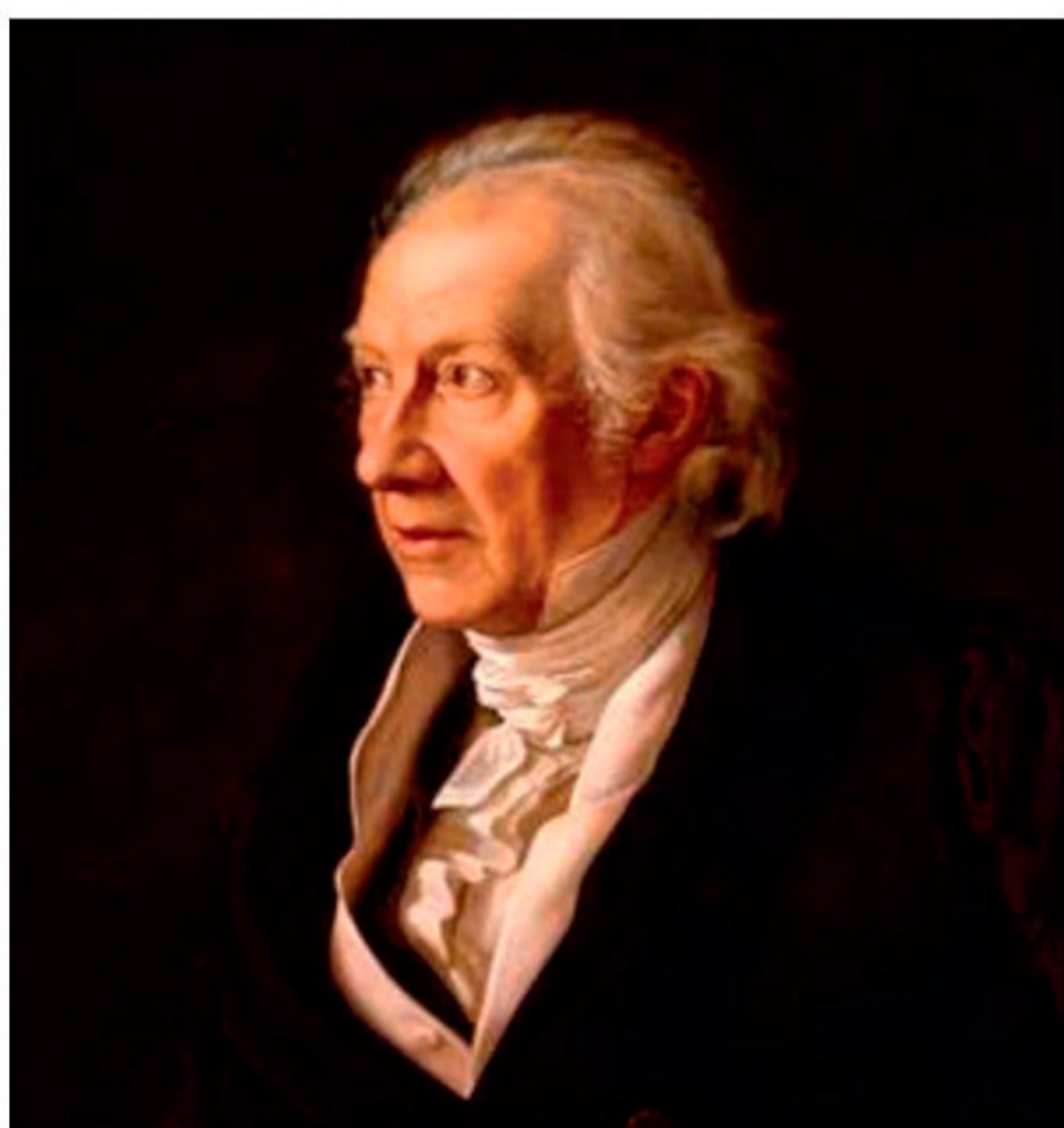
Carl Friedrich Zelter.

I 1834 udkom i Berlin en bog "Briefwechsel zwischen Goethe und Zelter", som omhandler breve de skrev til hinanden. Brevene er om alverdens kulturelle emner men også dagligdags ting. Carl Friedrich Zelter (1758-1832) var musiker, musikpædagog og komponist og ven med Johann Wolfgang Goethe (1749-1832), der var tysk digter og filosof. I stedet for at mødes skrev de ofte til hinanden, fordi Zelter boede i Berlin og Goethe i Weimar, hvor der er ca. 300 km. imellem.