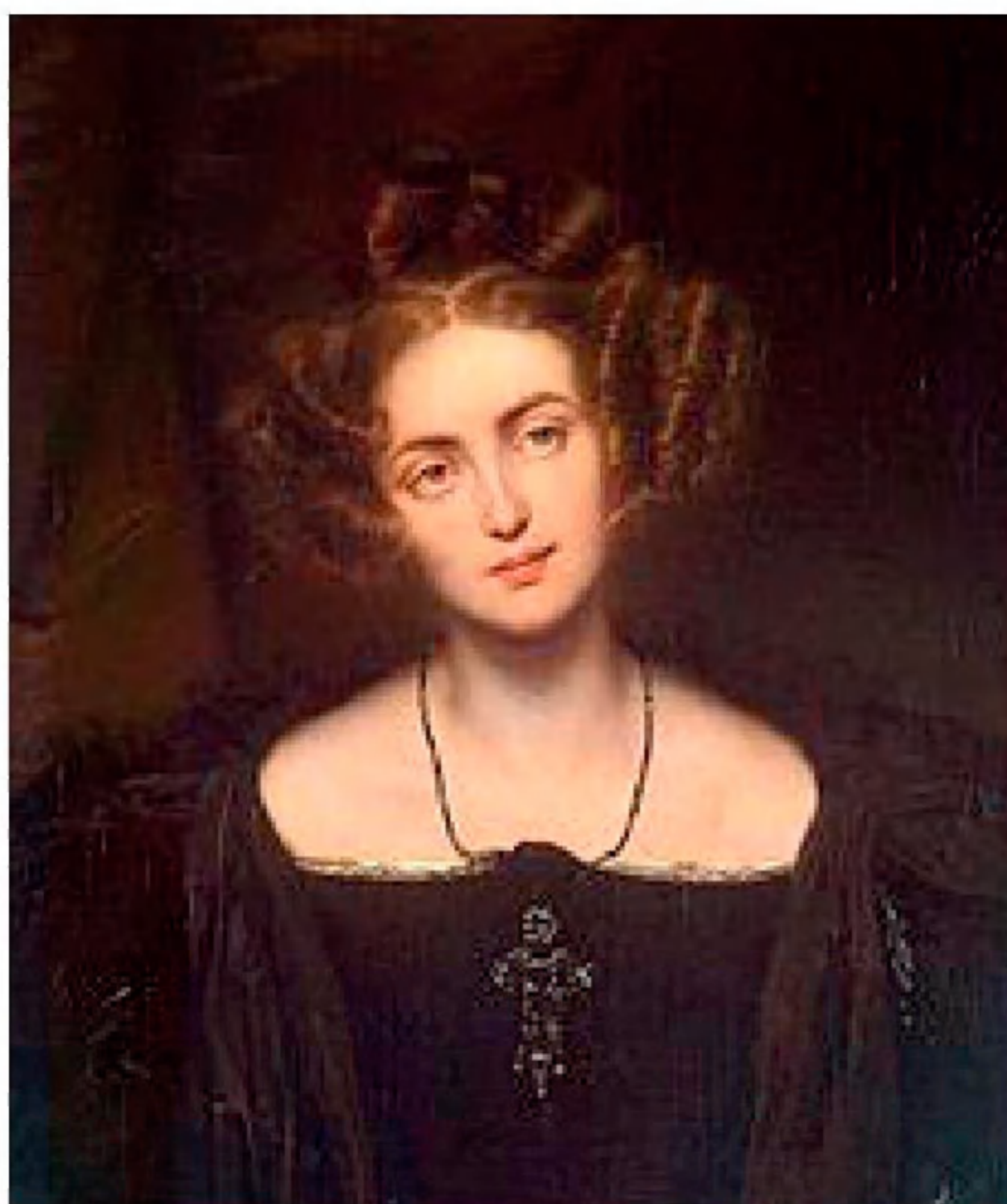
Henriette Sontag i 1831.

Den 10. februar 1828 altså 3 dage efter skrev Zelter så: