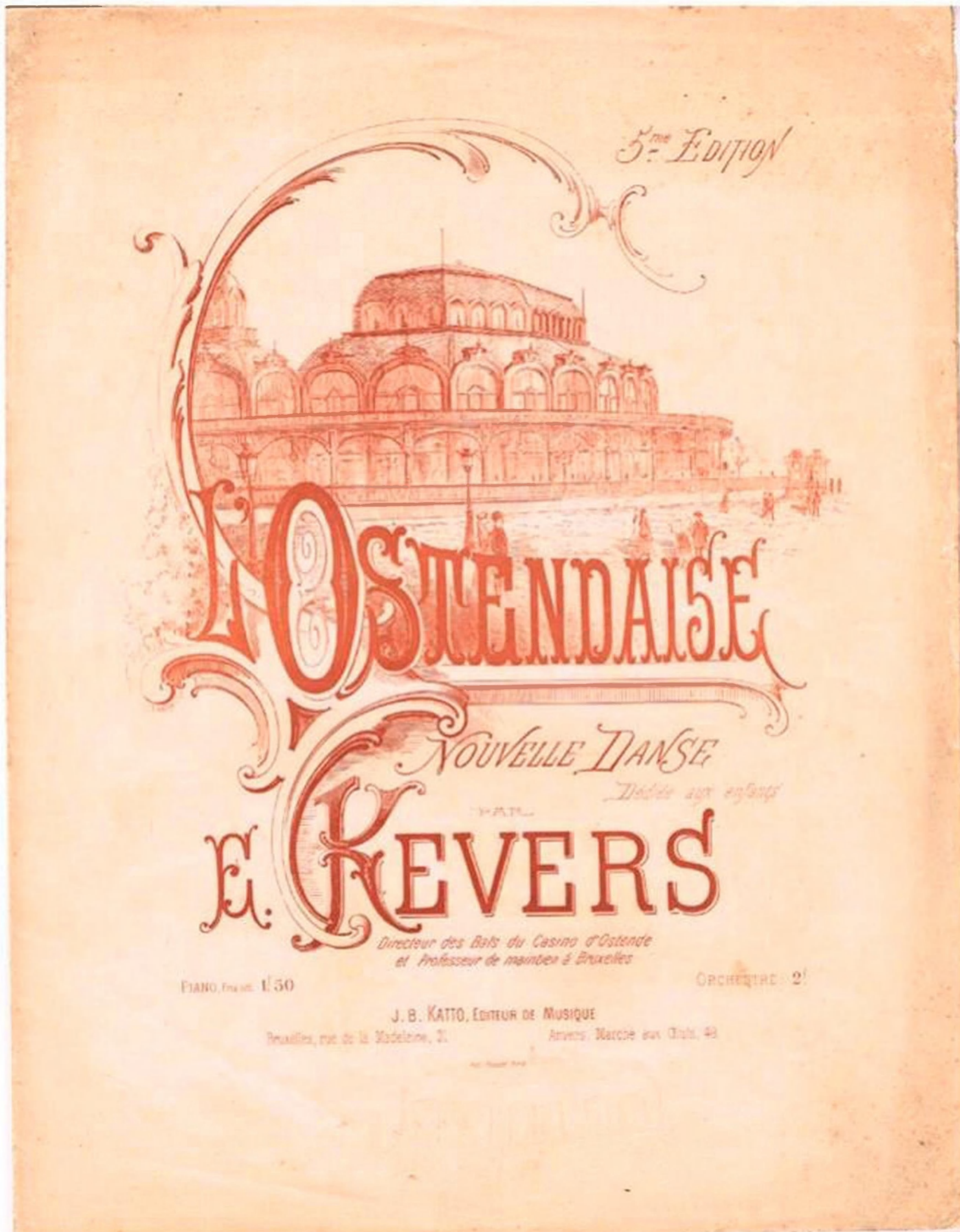
"L'Ostendaise" af Kevers Bruxelles 1865.

Dansemåden findes også i Belgien og Frankrig. Der hedder dansen "l'Ostendaise", altså "den fra Ostende", som er en by i Belgien. Den har samme opbygning med "4 langsomme og 8 hurtige" efterfulgt af polka. En variant af E. Ke-