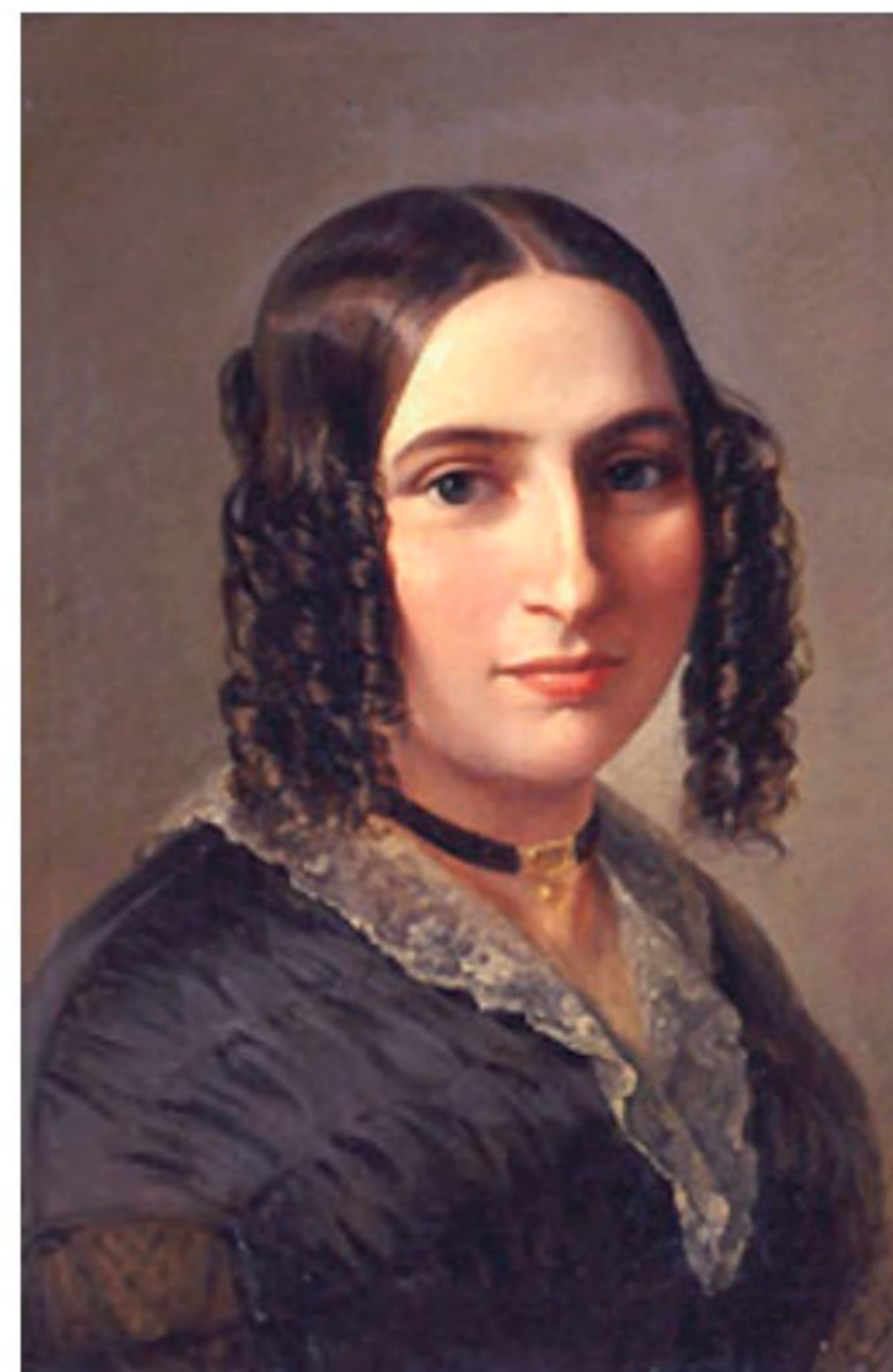
Fanny Hensel (Mendelsohn) malet af Moritz Daniel Oppenheim 1842.