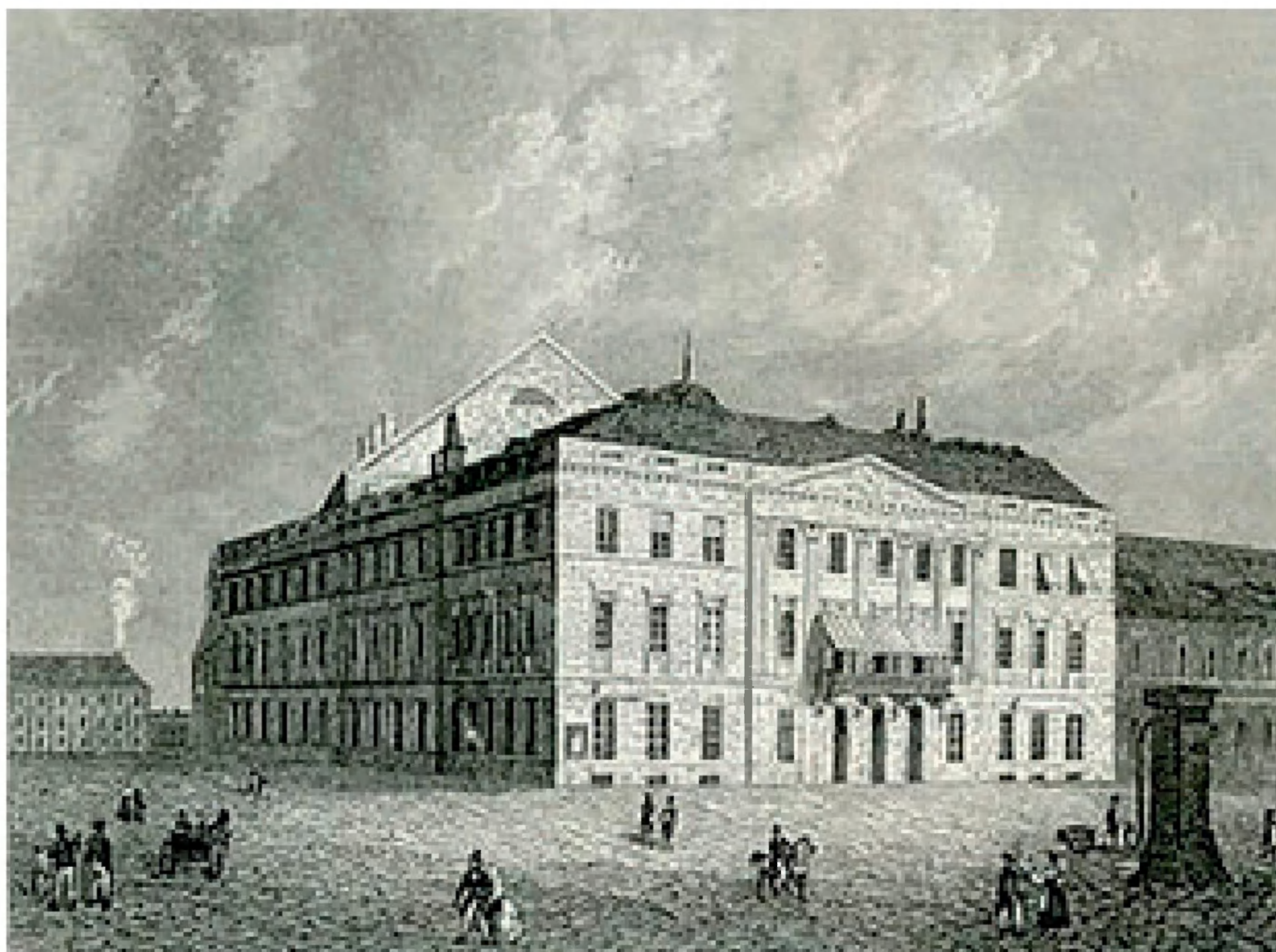
Königstädtische Theater i Berlin 1824.